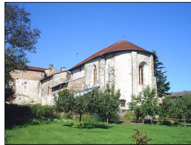
Petit jardin monastique autour du prieuré