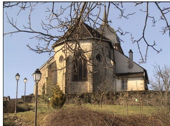
Eglise Paroissiale Saint-Pierre aux Liens

Ainsi, le pouvoir attractif de cet exceptionnel monument de l'an Mil ne fait que se renforcer d'année en année.