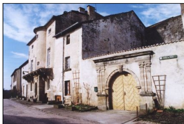
Hôtels du Faune et du Gouverneur