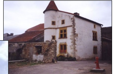
Hôtel de Sandrecourt