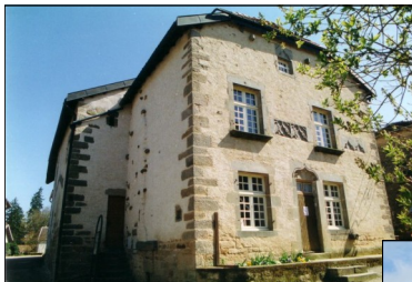
Grenier à Sel: Point d'Accueil Touristique

Curieux? Il convient de l'être si on veut tout voir de ce site. Tous les renseignements vous seront donnés sur place et des visites guidées du village ont lieu chaque jour pour vous permettre de découvrir ses richesses.