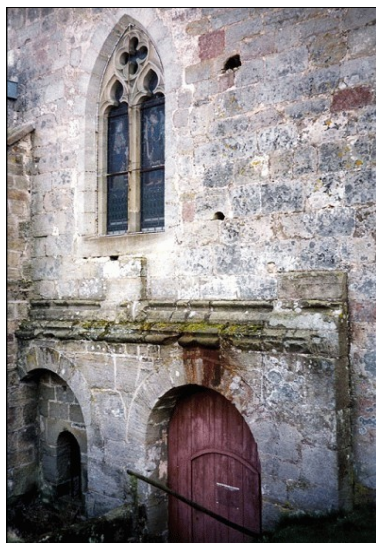
L'entrée de la Crypte

* La Crypte est ouverte en mai, juin et septembre, uniquement sur rendez-vous au 03.29.08.34.38 ou 03.29.08.12.54 ou 03.29.08.06.94. Elle est également ouverte du 1er juillet au 31 août, tous les mardis et vendredis de 14h à 18h.