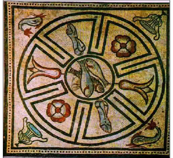
Mosaïque du II ème siècle