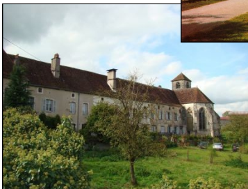
Eglise Notre-Dame des Anges