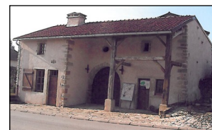
Maison Paysanne 18ème siècle