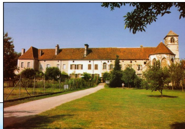
Couvent des Cordeliers

Enfin, pour les amateurs de repas à la ferme, le bâtiment abrite un restaurant campagnard de renom: le Couvent des Cordeliers.