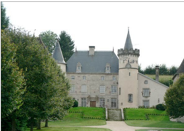
Le Château de Lichécourt

Ouverture de l'Eglise tous les jours de Pâques à la Toussaint.