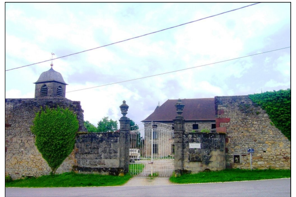
Entrée du Château des Hernecourt

Aujourd'hui le nouveau propriétaire restaure activement le château.