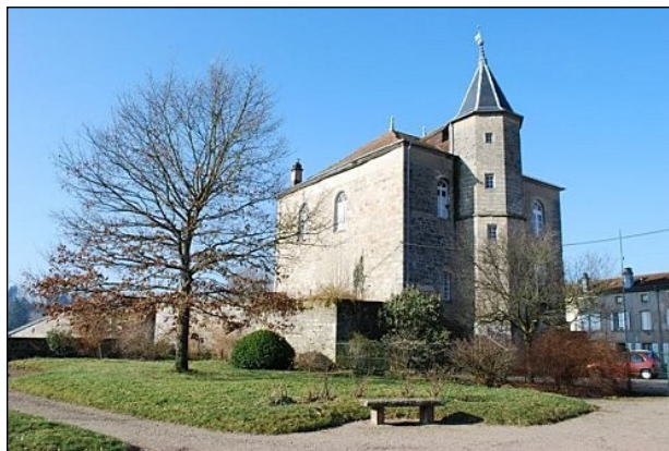
Le Château de Darney

Aujourd'hui, un musée abrite documents, objets et photographies en l'honneur de la Tchécoslovaquie et de nombreux Tchèques et Slovaques viennent chaque année visiter le musée et la commune de Darney, qui est jumelée avec Slavkov-Austerlitz.