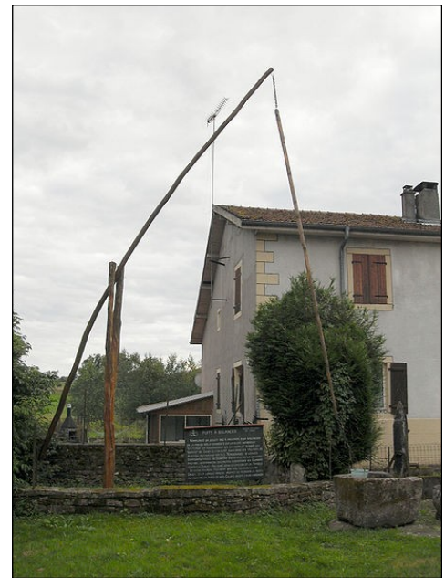
Puits à Balancier

Ce village typiquement lorrain saura séduire les amateurs du patrimoine régional.