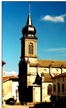
Eglise de la Nativité Notre-Dame