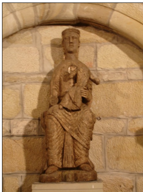
Vierge de la Chapelle d'Aureil-Maison