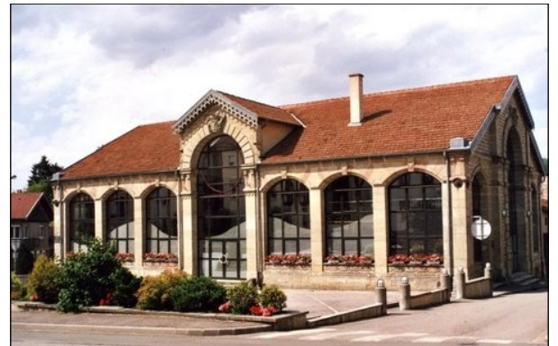
Les Halles de Lamarche

Aujourd'hui chef-lieu d'un canton étendu (26 communes), le bourg, son église Notre-Dame -XIII-XVIIème siècle) classée Monument Historique et sa chapelle romane d'Aureil-Maison, méritent une visite.