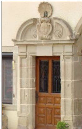
Porte du Relais de Saint-Jacques