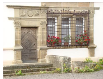
Maison de Justice