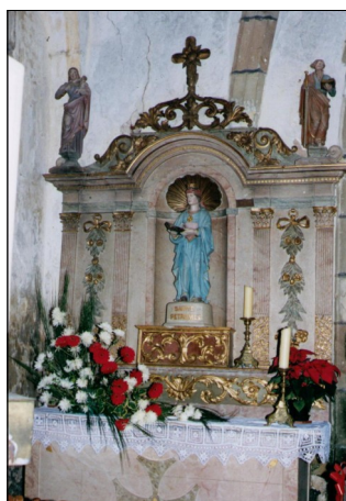
Statue de Sainte Pétronille