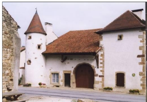
Maison du Laboureur

Elle mérite également une visite car c'est une des rares églises fortifiées de la région.