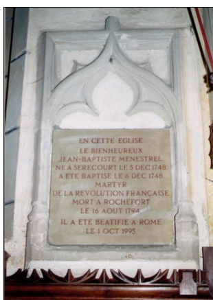
Plaque en l'honneur du bienheureux Jean-Baptiste Ménestrel

Maisons traditionnelles, église Saint-Mansuy.