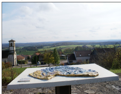
Vue depuis la table d'orientation, située sur les hauteurs de Jésonville

Ces pièces uniques méritent assurément un détour de votre part.