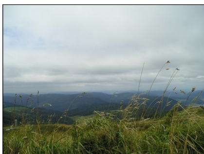
Vue de la Ligne Bleue des Vosges