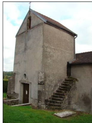
Eglise de Lironcourt

Une belle promenade pédestre vous attend aux abords de ce vignoble, sur le sentier balisé « Club Vosgien ».