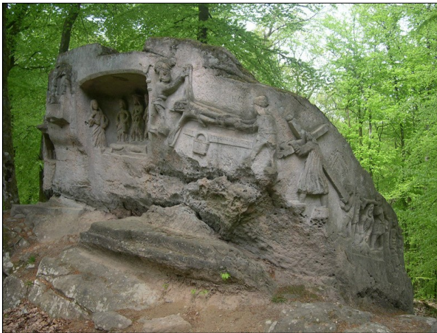
La Belle Roche

Un parking et un plan sont disponible au départ du sentier, devant l'église romane de Relanges.