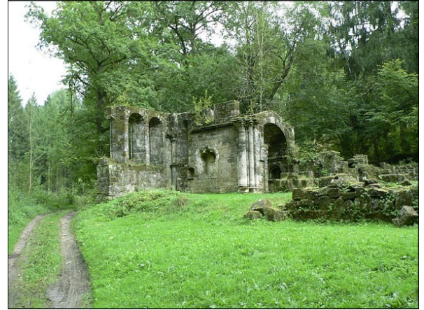
Le Prieuré de Bonneval

A 200m à l'ouest après une montée assez difficile, on accède à l'oppidum celtique, dont on retrouve les traces de manière très caractéristique: plateau, système de fossés défensifs à l'endroit le plus vulnérable, roches à cupules.