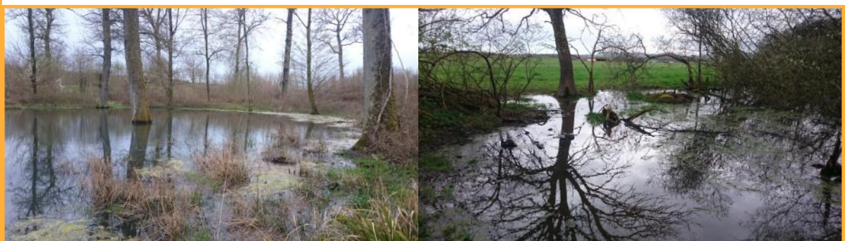
Mare forestière et mare de pré sur la commune de Vrécourt

Pour la ZPS « Bassigny partie Lorraine », le dispositif Natura 2000 peut devenir complémentaire à ce programme, puisque des aides au maintien et/ou la restauration des zones humides ou le rétablissement des mares sont proposées dans le Document d'Objectifs (DOCOB). Les aides sont plafonnées 2200€ par mare ; ces aides s'adressent aussi bien aux particuliers qu'aux organismes publics . Ce type de contrat peut idéalement être mis en place suite à la réalisation d'un état des lieux de la mare, par le CENL, dans le cadre du PRAM.